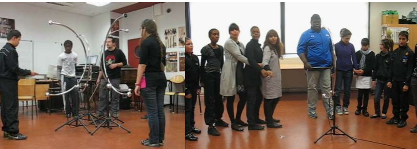
Les élèves du collège Henri – Barnier, Marseille