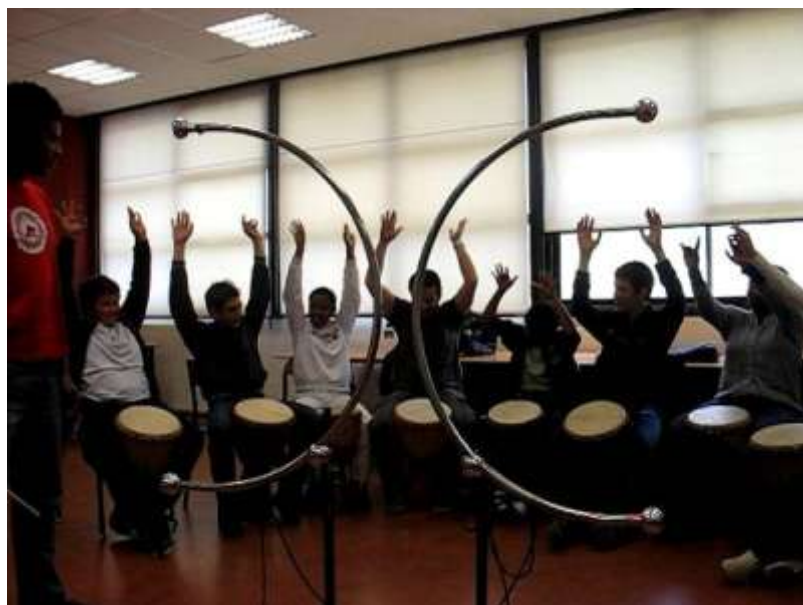
Les élèves d'UPI et de l'atelier de percussions du collège Henri – Barnier, Marseille